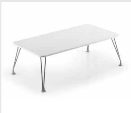
Tables basses rectangulaire et carrée / Square and rectangular low tables / Mesas bajas cuadrada y rectangulares