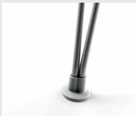
Patins antidérapants / Antiskid glides / Topes antideslizantes