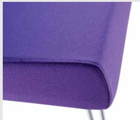
Généreux garnissage assise / Generous seat foam / Generoso relleno del asiento