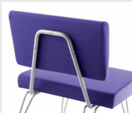
Détail vue dos / Back view detail / Detalle vista trasera