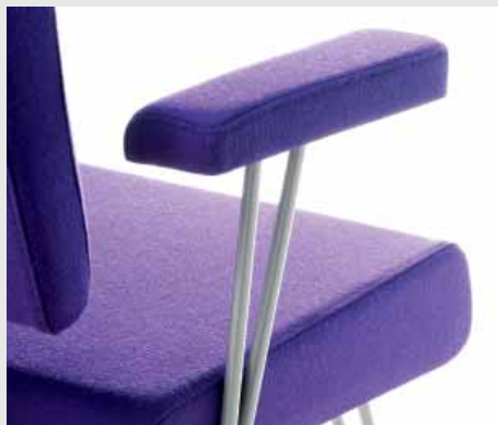
Accoudoir avec manchette tapissée / Fixed armrest with upholstered pad / Brazo con reposa brazo tapizado