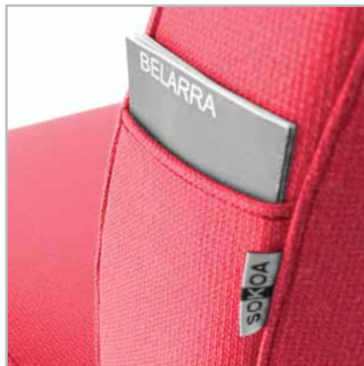
Notice d'instruction. Instruction use. Instrucciones de uso.